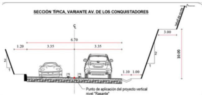
Figura Nro.3. Sección típica variante

Con las características geométricas mencionadas anteriormente, se elaboró la sección típica de la variante, adicionalmente, según los estudios de drenaje vial y estabilidad de taludes recomiendan colocar una cuneta de 1.10 m al lado de corte y un talud de 10 m de alto con bermas de 3m e inclinación 1:2, como se indica a continuación.