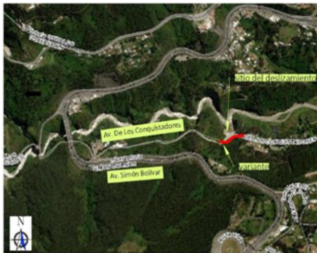
Figura 1: “Variante sobre la Av. de los Conquistadores”