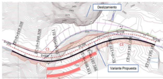
Figura Nro.2. Diseño Horizontal Variante

La Dirección de Estudios, luego de analizar los posibles factores que ocasionó el deslizamiento del tramo de vía, recomiendan realizar una variante cuyo eje tenga una separación del eje actual en un tramo adecuado, el cual permita cumplir las condiciones geométricas para una vía establecidas en las normas de Arquitectura y Urbanismo del DMQ y MTOP. Debido a la topografía montañosa del sitio, la variante propuesta estará en un corte cerrado desarrollándose paralelamente al tramo afectado y empatando a la vía existente en tangente.